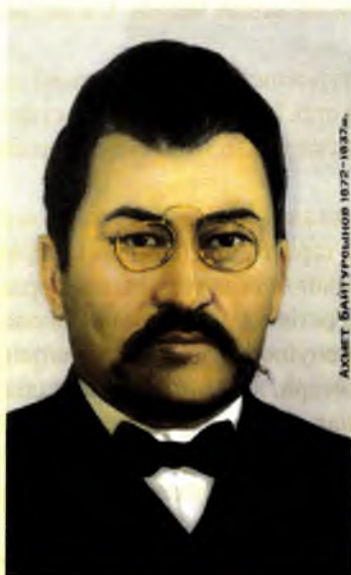
АХМЕТ БАЙТУРСЫНОВ 1872-1937.

В 2017 году отмечается 100-летний юбилей со дня основания политической партии «Алаш». Проект программы партии охватывал все важные направления для создания национального демократического государства, включая науку, образование, политику, правосудие и др. Однако полностью удалась лишь гуманитарная миссия алашординцев.